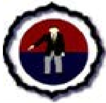
Associação de Árbitros de Judo de Portugal